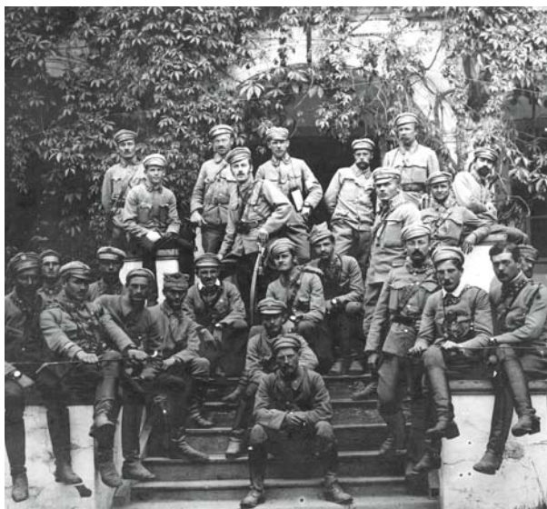
Oficerowie I Brygady Legionów Polskich na Sandomierszczyźnie w 1915 r.

jętnością zaryzykowania wszystkim, gdy ryzyko jest konieczne. Żołnierze, (...) smutno mi, że powinszować wam olbrzymich tryumfów nie mogę, lecz dumny jestem, że dzisiaj z większym spokojem mogę do was jak ongiś zawołać: Chłopczy! Naprzód! Na śmierć, czy na życie, na zwycięstwo, czy na klęskę – idźcie czynem wojennym budzić Polskę do zmartwychwstania!”.