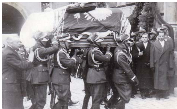
Generałowie Wojska Polskiego wnoszą trumnę z ciałem Józefa Piłsudskiego do Katedry Wawelskiej, 18 maja 1935 r.

„Przed Polską stoi wielkie pytanie: czy ma być państwem równorzędnym z wielkimi potęgami świata, czy ma być państwem małym, potrzebującym opieki możnych?”