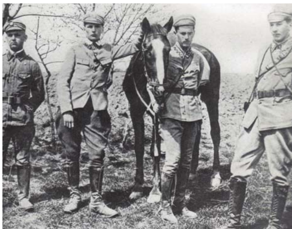
Oficerowie 5 pułku piechoty Legionów podczas walk w 1915 r. Drugi od lewej Stefan Rowecki, późniejszy Komendant Główny Armii Krajowej.

jętnością zaryzykowania wszystkim, gdy ryzyko jest konieczne. Żołnierze, (...) smutno mi, że powinszować wam olbrzymich tryumfów nie mogę, lecz dumny jestem, że dzisiaj z większym spokojem mogę do was jak ongiś zawołać: Chłopczy! Naprzód! Na śmierć, czy na życie, na zwycięstwo, czy na klęskę – idźcie czynem wojennym budzić Polskę do zmartwychwstania!”.