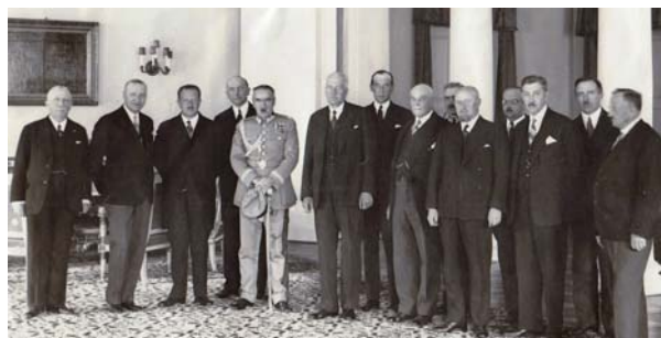
Zaprzysiężenie rządu pod przewodnictwem Józefa Piłsudskiego, 1930 r.

15 XII – Marszałek Józef Piłsudski udał się na trzymiesięczny wypoczynek na Maderę.