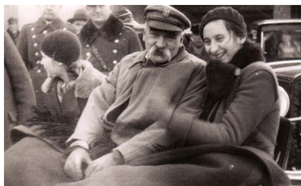
Józef Piłsudski z córkami podczas odpoczynku w Krynicy Górskiej w 1933 r.