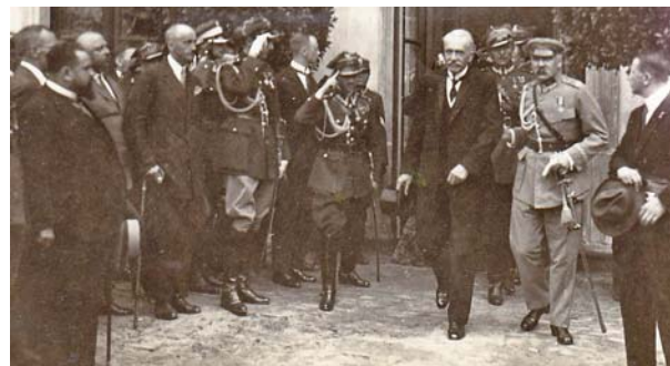
Uroczystość zaprzysiężenia prezydenta RP prof. Ignacego Mościckiego, 1 czerwca 1926 r.