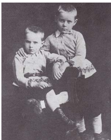
Józef Piłsudski (z lewej) z bratem Bronisławem. Jedno z pierwszych zdjęć przyszłego Marszałka wykonane w atelier w Wilnie w latach 70-tych XIX wieku