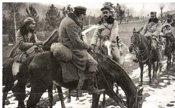
Józef Piłsudski ze sztabem podczas walk legionowych na Podhalu, grudzień 1914 r.

15 XI – Rozkazem Naczelnego Wodza CK Armii arcyksięcia Fryderyka, Józef Piłsudski został mianowany na stopień brygadiera. Stopnia tego Piłsudski używał wyłącznie w relacjach zewnętrznych, natomiast w dowodzonych przez niego oddziałach, tytułowany był przez legionistów Komendantem.