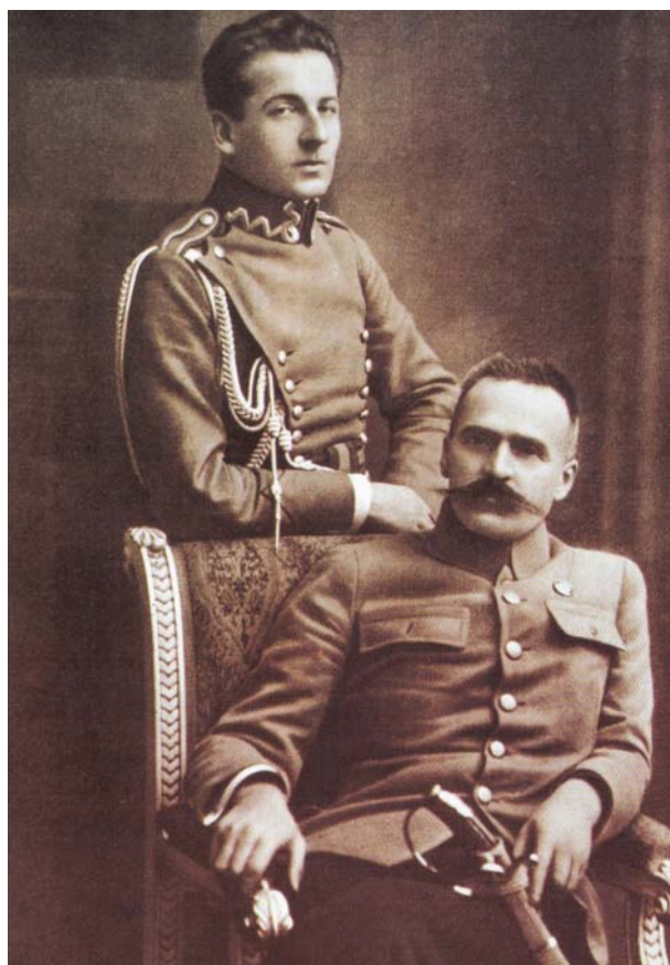
Józef Piłsudski ze swoim adiutantem Bolesławem Wieniawą-Długoszowskim

21 I – w przededniu rocznicy wybuchu powstania styczniowego Naczelny Wódz Józef Piłsudski wydał rozkaz nadający wszystkim weteranom powstania prawa żołnierzy Wojska Polskiego, w tym przywilej noszenia galowych mundurów w uroczyste dni. W rozkazie Piłsudski stwierdzał m.in.: „Dla nas, żołnierzy wolnej Polski, powstańcy 1863 r. są i pozostaną ostatnimi żołnierzami Polski, walczącej o swą swobodę, pozostaną wzorem wielu cnót żołnierskich, które naśladować będziemy”.