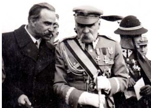
Józef Piłsudski z prezydentem Krakowa płk. Władysławem Beliną-Prażmowskim podczas święta kawalerii, 6 października 1933 r.

11 XI – wielka defilada Wojska Polskiego na Polu Mokotowskim w Warszawie w rocznicę odzyskania niepodległości. Była to ostatnia defilada z udziałem Marszałka Józefa Piłsudskiego.