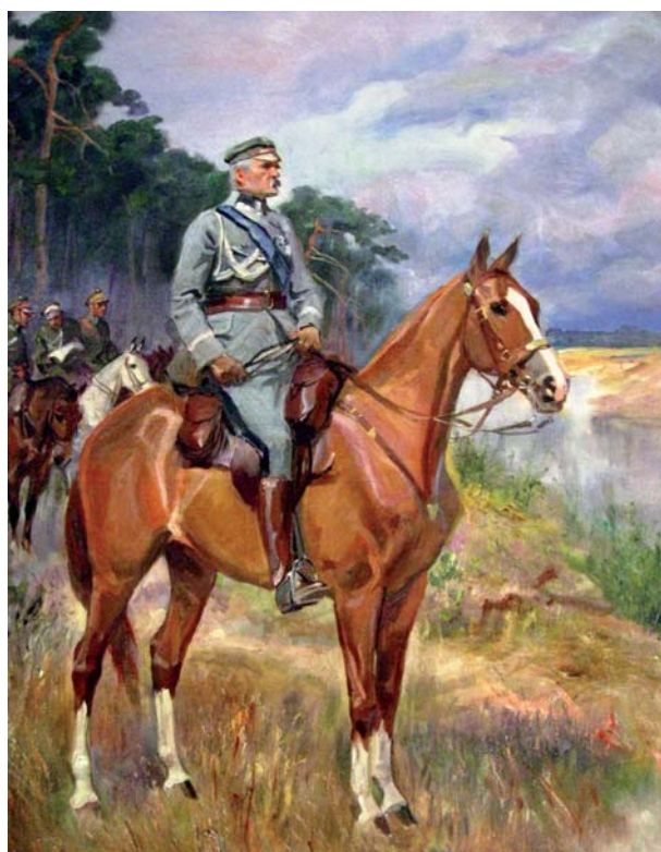
Marszałek na Kasztance, obraz Wojciecha Kossaka ze zbiorów Instytutu Józefa Piłsudskiego w Nowym Jorku

8 VIII – w Kielcach odbył się V Zjazd Legionistów z udziałem Józefa Piłsudskiego. Podczas przemówienia Marszałek stwierdził m.in. „Kielce są tak wyjątkowo drogie myślom i wspomnieniom wielkiej części legionistów, bo tu był pierwszy pocałunek wojny”.