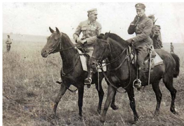
Józef Piłsudski na ulubionej klaczy Kasztance, wiosna 1915 r.