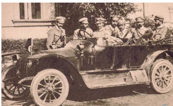
Józef Piłsudski ze współpracownikami po zajęciu Kielc przez Pierwszą Kompanię Kadrową 12 sierpnia 1914 r.

10 VIII – Józef Piłsudski wydał odezwę do ludności polskiej, w której stwierdzał: „Polska przestała być niewolnicą i sama chce stanowić o swoim losie, sama chce budować swą przyszłość, rzucając na szalę wypadków własną siłę orężną. Kadry armii polskiej wkroczyły na ziemię Królestwa Polskiego, zajmując ją na rzecz jej właściwego, istotnego, jedyne gospodarza – Ludu Polskiego... Niesiemy całemu narodowi rozkucie kajdan. Z dniem dzisiejszym cały naród skupić się winien w jednym obozie pod kierownictwem Rządu Narodowego. Poza tym obozem zostaną tylko zdrajcy, dla których potrafimy być bezwzględni”.