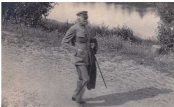
Spacer nad Niemnem w Druskiennikach, 1931 r.