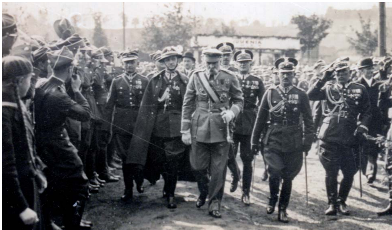
Marszałek w otoczeniu oficerów podczas obchodów 250. rocznicy Odsieczy Wiedeńskiej, Kraków, 6 października 1933 r.

kowej, lewicowej, centrowej, podpisywane przez przeciwników politycznych: Romana Dmowskiego, Macieja Rataja, Mieczysława Niedziałkowskiego, sygnalizowały wyraźnie, iż był politykiem niezwykłym, że bez jego imponującej charyzmy i osobowości nie powstałby wielki obóz ludzi wielce mu oddanych, a losy Polski nie wyglądałyby tak samo ani w 1918 roku, ani w 1920 roku.