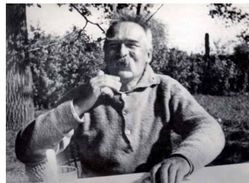
Odoczynek przy ulubionej czarnej herbacie