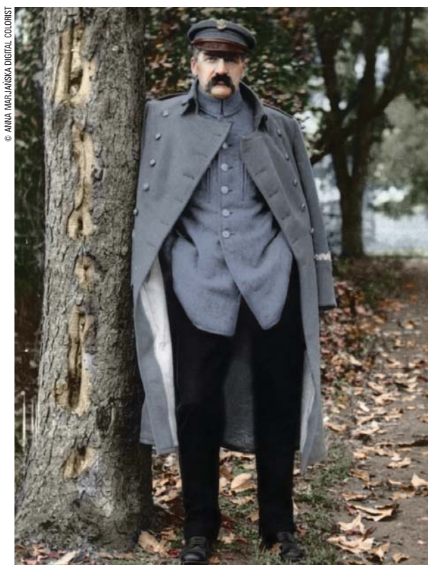
Józef Piłsudski w Druskiennikach 2 połowa lat 20-tych

Piłsudski stawał się dla swych legunów jedynym właściwie punktem odniesienia. Zdawał sobie z tego doskonale sprawę. Czuł brzemień odpowiedzialności za rozbudzone marzenia i nadzieje. Wiedział, że nawet czyniki marginalne, takie jak postawa, ruchy, spojrzenia, gesty wpływają na odbiór wodza przez żołnierzy, a tym