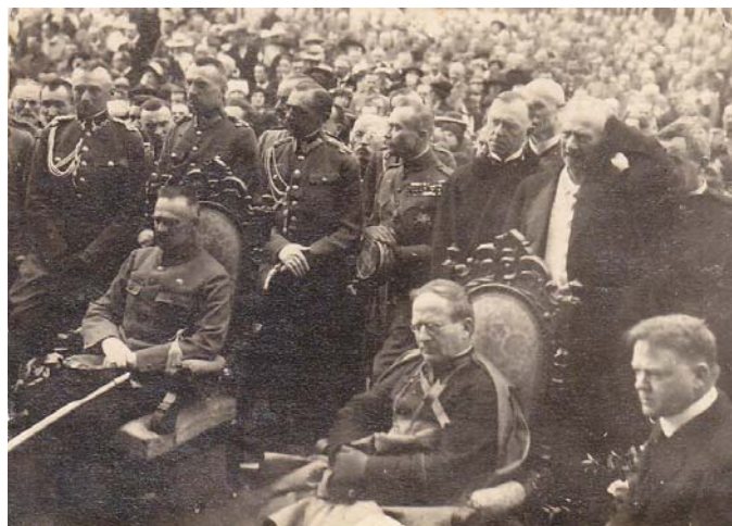
Uroczystość patriotyczna na Placu Saskim w Warszawie. Obok Józefa Piłsudskiego siedzi nuncjusz apostolski w Polsce Achilles Ratti, późniejszy papież Pius XI

16 III – były nuncjusz apostolski w Polsce Ojciec św. Pius XI (Achilles Ratti) za pośrednictwem kard. Aleksandra Kakowskiego przekazał Marszałkowi Józefowi Piłsudskiemu specjalne błogosławieństwo, w którym napisał: „Przesyłamy Naszemu Kochanemu Synowi w Chrystusie Józefowi Piłsudskiemu, Naczelnikowi Państwa Polskiego, błogosławiąc z uczuciem szczególnej i niezmiernej życzliwości Jego i Jego szlachetny, drogi naszemu sercu kraj”.