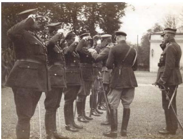
Józef Piłsudski wręcza Ordery Wojenne Virtuti Militari oficerom wslawionym w bojach wojny polsko-bolszewickiej, Belweder 1921 r.

18 X – oficjalnie wstrzymano działania zbrojne na froncie polsko-bolszewickim. Józef Piłsudski wydał rozkaz do żołnierzy na zakończenie wojny polsko-bolszewickiej, w którym pisał m.in.: „od pierwszej chwili życia swobodnej Polski, wyciągnęło się ku niej mnóstwo pożądliwych rąk, by ją utrzymać w stanie bezsiły, by jeśli już istnieje, była igraszką w ręku innych, biernym polem dla intryg całego świata. Naród polski porwał się jednak do broni, zrobił ogromny wysiłek. Kraj, co w dwa lata potrafił wytworzyć takiego żołnierza, jakim wy jesteście, może spokojnie patrzeć w przyszłość”.