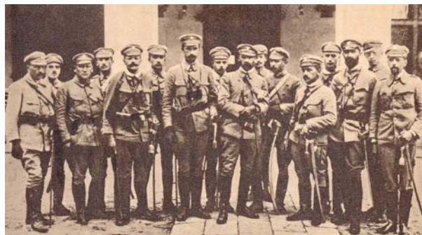
Kielce, sierpień 1914 r., Józef Piłsudski ze sztabem oddziałów strzeleckich przed kwaterą w pałacu biskupów.

12 VIII – do Kielc wkroczył Batalion Kadrowy, który stoczył w godzinach popołudniowych walki z Rosjanami na folwarku Czarnów i w okolicach Szydłówka i Zagórze.