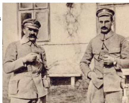
Józef Piłsudski i Kazimierz Sosnkowski podczas walk legionowych w marcu 1915 r.

19 XII – w zajętych przez legionistów Nowym Sączu sformowano I Brygadę Legionów Polskich w skład której weszły 1., 5. i 7. Pułku Piechoty oraz Pułku Kawalerii i Pułku Artylerii. Komendę nad Brygadą objął Józef Piłsudski.