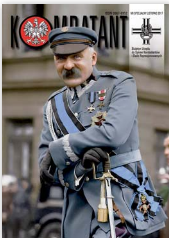
Marszałek Józef Piłsudski, Warszawa 1929 r.

BIULETYN URZĘDU DO SPRAW KOMBATANTÓW I OSÓB REPRESJONOWANYCH