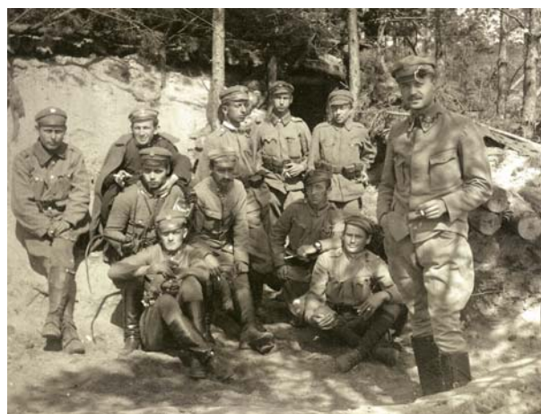
Legioniści Pierwszej Brygady na foncie wołyńskim w lipcu 1916 r.

„ Piłsudski działał w czasach, w których Polacy pragnęli przywódcy odzwierciedlającego i uosabiającego „pierwiastki narodowe”