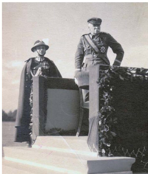
Błonia krakowskie, Józef Piłsudski przyjmuje defiladę z okazji 250. rocznicy Odsieczy Wiedeńskiej, Kraków, 6 października 1933 r.

sudskiemu nieuczciwości, obserwując, jak co dzień spaceruje Alejami Ujazdowskimi, bez obstawy, w wymiętych spodniach, niedbale założonym mundurze, rzadko przy orderach, z nieuczczonym wąsem. Żył skromnie, córki do szkół posyłał tramwajem, pensję oddawał na wileński Uniwersytet Stefana Batorego. Był przez to bliski. I może właśnie dlatego wywierał autentyczny wpływ na społeczeństwo, w przeważającej większości widzące w nim nie tylko „męża opatrnościowego”, ale przede wszystkim „Dziadka”. Był więc już za życia i żywym pomnikiem, i – swego rodzaju – członkiem rodziny.