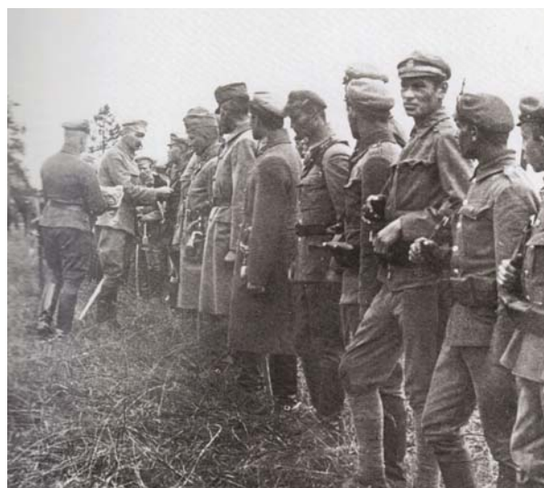
Józef Piłsudski wręcza odznakę „Za Wierną Służbę” legionistom I Brygady, sierpień 1916 r.