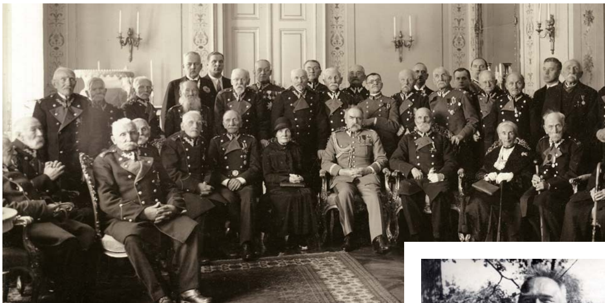
Józef Piłsudski w otoczeniu weteranów Powstania Styczniowego 1863 roku Belweder, styczeń 1933 r.