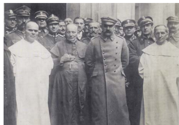
Jasna Góra, październik 1921 r. Józef Piłsudski podczas pielgrzymki dziękczynnej za zwycięstwo nad bolszewikami

7–9 X – wykonując tajne polecenie Józefa Piłsudskiego, kilka pułków tworzących Grupę Operacyjną „Bieniakonie” pod dowództwem gen. Lucjana Żeligowskiego oficjalnie „wypowiedziało posłuszeństwo” polskiemu dowództwu i zajęły zbrojnie Wilno i Wileńszczyznę, wypierając stamtąd wojska litewskie (tzw. „bunt Żeligowskiego”). Jak wspominał gen. Lucjan Żeligowski, Józef Piłsudski podczas rozmowy 20 września 1920 r. powiedział mu: „Jeżeli teraz Wilna nie wyratujemy, to historia nam tego nie daruje. (...) Trzeba, aby ktoś wziął na siebie całą sprawę. (...) Tylko pamiętać należy, że wszystkich mamy przeciwko sobie, nawet społeczeństwo polskie, które nie rozumie sprawy litewskiej. Może nastać chwila, kiedy będzie pan miał przeciwko sobie nie tylko opinię świata, ale i Polski. (...) Trzeba to wszystko wziąć na siebie. Tego nie mogę rozkazać. Takich rzeczy się nie rozkazuje”. Na zajętych obszarze powołano samodzielny twór państwowy – Litwę Środkową.