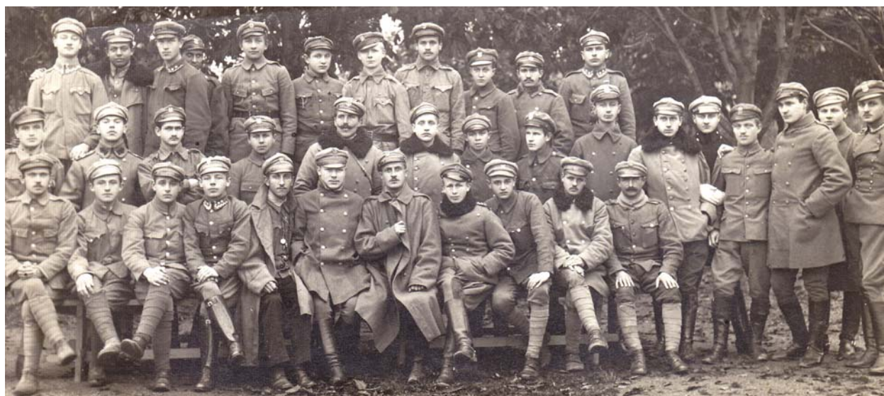
Legioniści Pierwszej Brygady w czasie kryzysu przysięgowego w lipcu 1917 r.

10 XI – do Warszawy powrócił z niewoli niemieckiej w Magdeburgu Józef Piłsudski. Żołnierze POW zaczęli masową akcję rozbrajania oddziałów niemieckich stacjonujących w Warszawie.