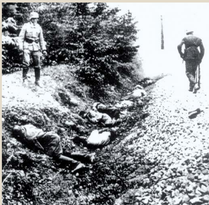
Żołnierze bohaterskiego batalionu 74. Górnos Śląskiego Pułku Piechoty WP nie dali się okrzyć pod Częstochową. W walce dotarli w rejon Iłży. Zostali rozstrzelani w Ciepelowie k. Iłży 8 września 1939 r. przez żołnierzy Wehrmachtu jako jeńcy. Niemcy pogwałcili konwencję genewską o jeńcach.