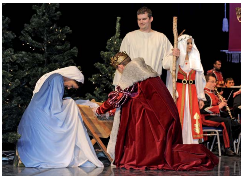
Scena z jasełek w wykonaniu artystów z Reprezentacyjnego Zespołu Artystycznego Wojska Polskiego

„Dzisiejsze spotkanie ma charakter świąteczny” – odczytał słowa marszałka dyrektor Ważbiński. „Jest nam niezwykle miło, że możemy dołączyć swoją cegiełkę do dzieła integracji i współpracy środowisk