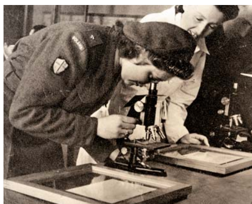
Nauka w laboratorium na uniwersytecie w Bolonii we Włoszech

ŚWIĘTA PANIENKO Z AMBRO NAUCZYCIELE I UCZNIOWIE GIMNAZJUM I LICEUM 3 DYWIZJI STRZELCÓW KARPACKICH ŻOŁNIERZE 2 KORPUSU POLSKIEGO KTÓRZY PO ZAKOŃCZENIU DZIAŁAŃ WOJENNYCH W ITALII W MIASTACH AMANDOLA I SARNANO W LICZBIE 1000 – ROK PRACY SZKOLNEJ PRZEŻYLI PROSZĄ CIĘ W POKORZE POWRÓĆ NAS CUDEM NA OJCZYZNY ŁONO