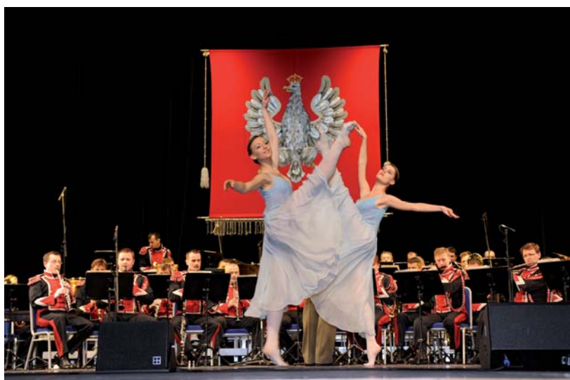
Podczas spektaklu artystów z Reprezentacyjnego Zespołu Artystycznego Wojska Polskiego