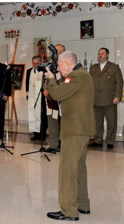
Podczas modlitwy ekumenicznej

Minister, uczestniczący w tym dniu na uroczystościach upamiętniających wydarzenia w kopalni Wu-