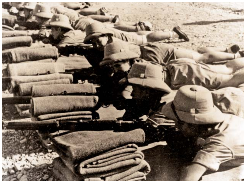
Junacy – nauka strzelania.

1945 r. stworzył Dywizyjny Kurs Gimnazjalny i Licealny. Rozpoczął się on 20 stycznia 1945 r. w małym miasteczku Bagno di Romagna;