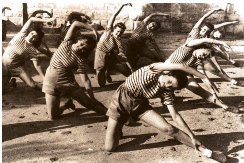
Pomocnicza Służba Kobiet. Ćwiczenia gimnastyczne.

Gdy dywizja weszła ponownie do akcji, 21 kwietnia 1945 r. szkoła została przeniesiona bliżej frontu, do miasteczka Terra del Sole. W tym samym dniu oddziały 3. Dywizji Strzelców Karpackich weszły do oswobodzonej Bolonii. Działania wojenne w Italii zakończyły się 28