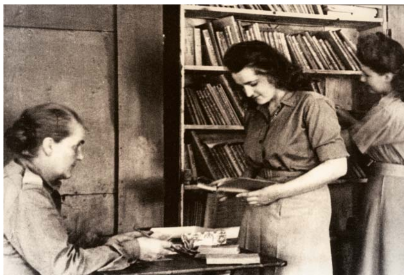
Pomocnicza Służba Kobiet. Biblioteka

nych kolejowych. Przed świętami Bożego Narodzenia pracowali w Londynie w halach Caledonian Market przy sortowaniu worków z pocztą świąteczną.