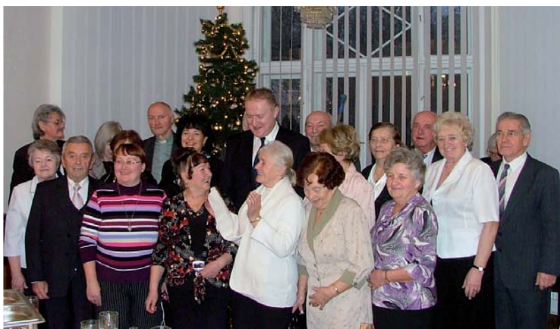
Przy świątecznym stole dzielono się opłatkiem i śpiewano kolędy