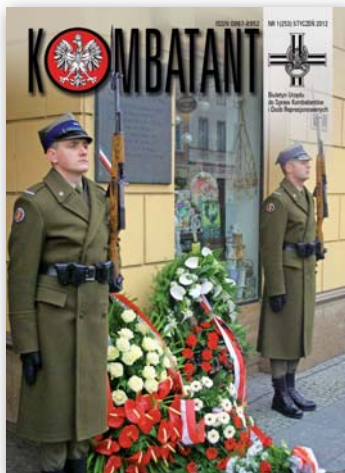
Tablica ku czci Jerzego Iwanowiczajnowicza na Nowym Świecie w Warszawie

BIULETYN URZĘDU DO SPRAW KOMBATANTÓW I OSÓB REPRESJONOWANYCH