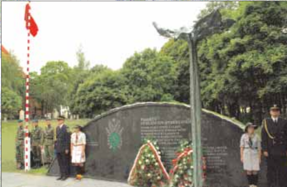
Pomnik Sybiraków w Olsztynie po ceremonii odsłonięcia

Na zaproszenie prezydenta Olsztyna i Zarządu Oddziału Związku Sybiraków w Olsztynie, w dniach 16-22 września w podolsztyńskim ośrodku turystycznym Star-Dadaj odbył się III Światowy Zjazd Polskich Sierot Byłych Wychowanków Syberyjskich Domów Dziecka z lat 1940-1946. Na zjazd przyjechało 70 uczestników z całej Polski i innych państw.