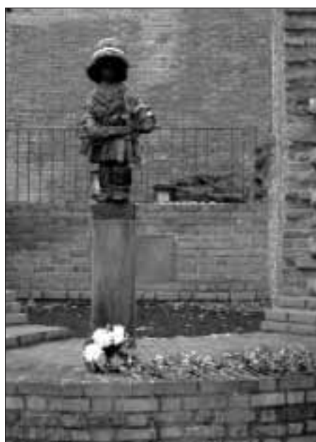
Po spotkaniu młodzież zaniosiła białe i czerwone róże przed Pomnik Małego Powstańca