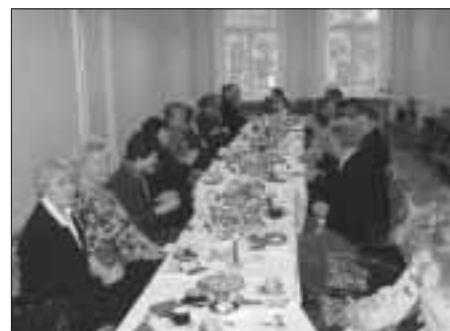
Uczestnicy spotkania – członkowie Zarządu Związku Polaków na Łotwie