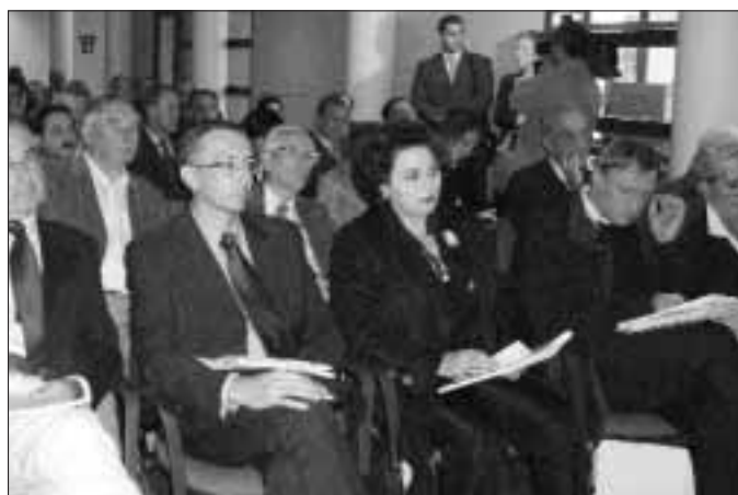
W Materze odbyła się sesja naukowa w 62. rocznicę tragicznych dla miasta wydarzeń