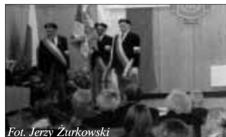
Fot. Jerzy Żurkowski