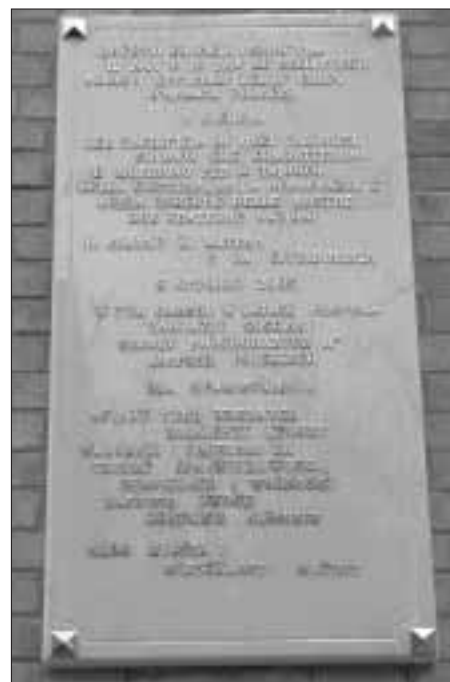
Tablica upamiętniająca pobyt w Materze polskich żołnierzy

Rocznicowe uroczystości w Alessano zakończyła odprawiona w niedzielę 9 października w miejscowej katedrze – gdzie w 1945 r. wmurowano naszą tablicę pamiątkową – przez polskiego „alessańczyka” abp. Sz. Wesołego uroczysta Msza św., po której odśpiewano „Arkę” i „Boże coś Polskę”, zakończoną po 60. latach błaganiem „Ojczyznę wolną pobłogosław Panie”.