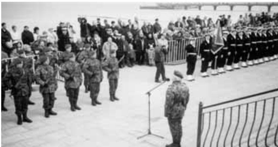
18 marca. Uroczystość przed Pomnikiem Zaślubin z Morzem

Na uroczystości jubileuszowe do Kołobrzegu jak co roku licznie przybyli kombatancki, którzy zdobywali to miasto 57 lat temu. Przybyli, by oddać hołd poległym kolegom, a także by spotkać się z towarzyszami broni i powspominać te ciężkie boje, z których wyszli zwycięsko.