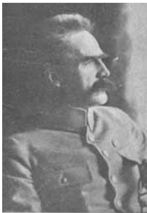
ВОСИП ПИЛСУДСКИЙ командующий войсками Начальник Польской Рагубины

Czas biegł, narastał chaos, pogarszała się sytuacja ekonomiczna Litwy Środkowej. Na 8 stycznia 1922 r., wyznaczono wybory do Sejmu, w których zwyciężył Polski Centralny Komitet Wyborczy, który już 20 lutego podjął niemal jednogłośnie uchwałę o połączeniu Litwy Środkowej z Rzeczpospolitą. Sejm Ustawodawczy RP przed osiemdziesięciu laty – 24 marca 1922 r. – wezwał rząd,