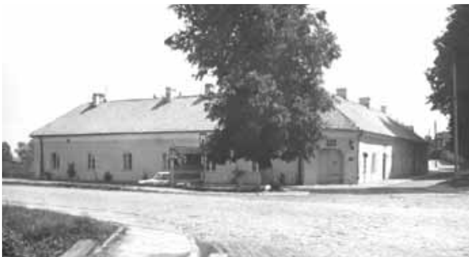
Alumnat w Tykocinie

Gmach alumnatu w Tykocinie przetrwał do dziś, co widać na załączonym zdjęciu, ale nie służy już inwalidom i weteranom. Zachował natomiast swój zabytkowy charakter i jest godzien odwiedzenia, zwłaszcza że miasteczko bywa nazywane podlaską perłą baroku, słynie z Muzeum Żydowskiego w synagodze z 1642 roku, ruin zamku opisanego w „Pociepie”, bogato wyposażonego kościoła Św. Trójcy, pomnika Stefana Czarnieckiego z lat 70. XVIII wieku i pomnika Orła Białego. Mało kto w Polsce wie, że właśnie w Tykocinie król August II ustanowił w 1705 roku Order Orła Białego.