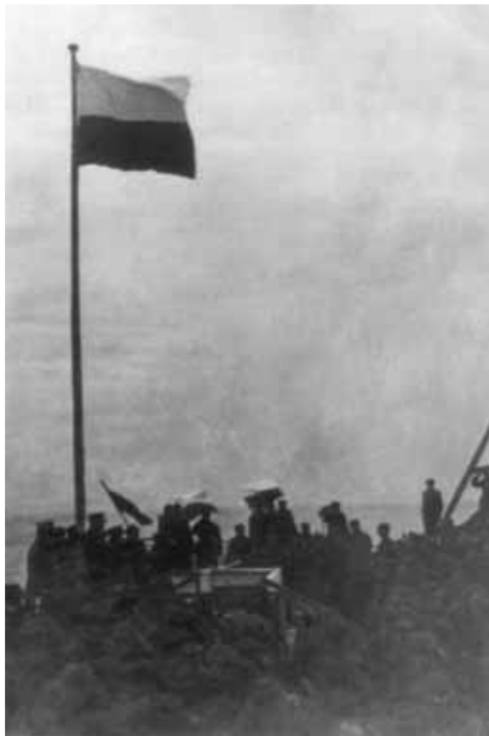
Wciągnięcie flagi na maszt. Kołobrzeg 1945 r.

W takiej sytuacji łatwo o upadek ducha, co miało miejsce m.in. w 3 batalionie 14 pp. Teraz można było poznać klasę dowódców i te oceny wypadały bardzo różnie, niezależnie od narodowości oraz stażu frontowego. Notabene różnie bywało i wcześniej z relacjami między żołnierzami a dowódcami, zwłaszcza w kompaniach oraz batalionach z liniowymi oficerami radzieckimi. Podczas szturmów zapomniano na ogół o animozjach, gra toczyła się o przeżycie i sukces. Natomiast wciąż słabiej znamy realia po stronie niemieckiej. Jak dalece stosowano tam drastyczne represje wobec słabnących w oporze? Jaką rolę ode-